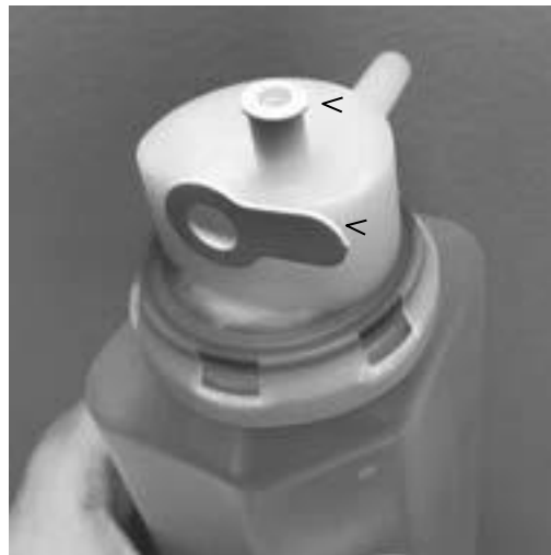
(a) アウトレットプラグ