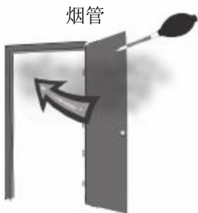
图 1 烟雾从门口飘入

说明： 装置的位置不得靠近空调回风格栅、排气扇或通风口，或者空气飘出的门或窗。切记，顺风而非逆风安装。