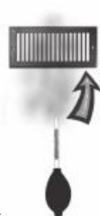
图 3 烟雾进入空调风口