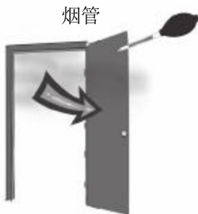
图 2 烟雾飘出门口